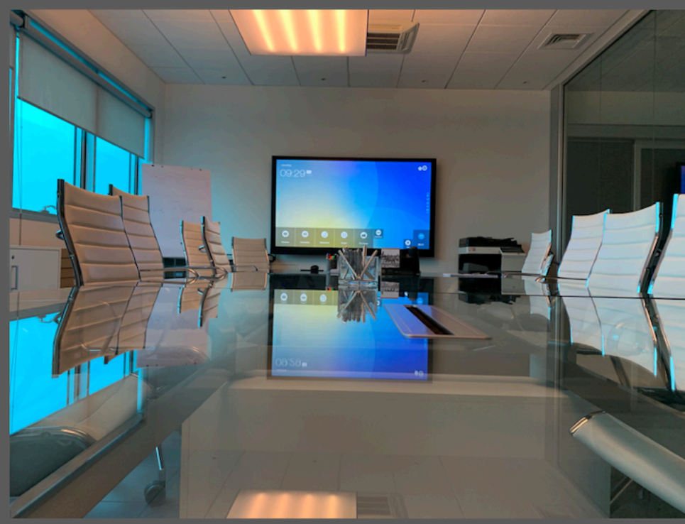
Una della sale meeting Dorelan, con al centro il monitor Newline, serie VN

Per un'azienda che adotta da sempre processi tecnologicamente avanzati per la produzione delle proprie soluzioni, le sale meeting rappresentano gli ambienti cruciali per il confronto tra professionisti. Parliamo di Dorelan, azienda che da oltre 50 anni progettata soluzioni dedicate ad uno dei comfort principali di ogni persona: il riposo, passando da materassi, topper, letti, reti, sommier, cuscini, ecc. In questo contesto, in tre distinte sale riunioni, di recente sono stati installati 3 monitor interattivi 4K Newline, serie VN da 86" . L'intera installazione e configurazione delle lavagne interattive è